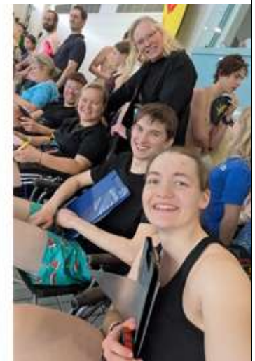
Coaching vom Beckenrand