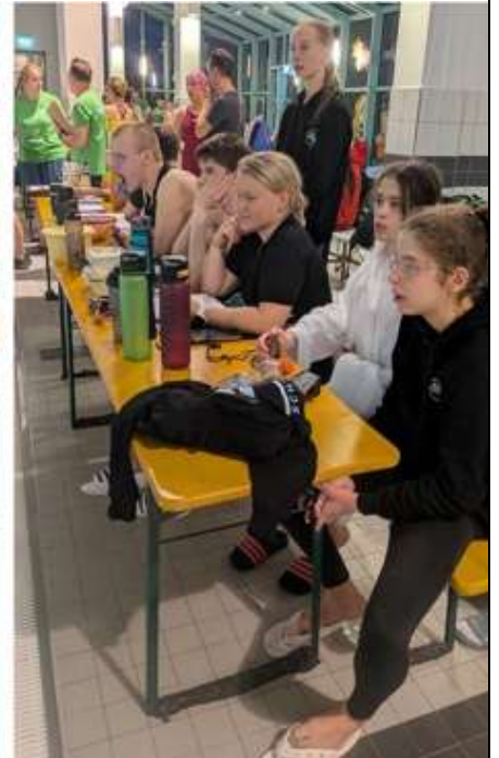
Zusammen als Mannschaft haben wir „abgeliefert“