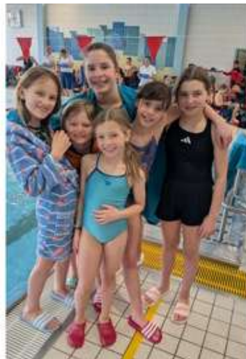
Neues Jahr, neuer Wettkampf