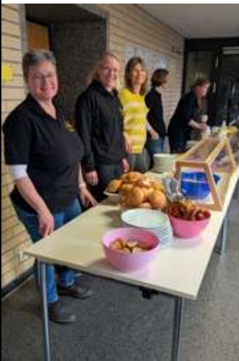
Fleißige Helfer beim Buffet des SCU

Ein riesengroßes Dankeschön geht an unser Orga-Team und an alle Eltern, die beim Essensverkauf geholfen haben! Ohne euch wäre das nicht möglich gewesen.