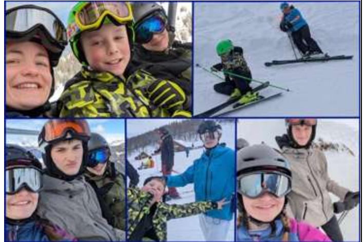
Skifahren: Tolle Berge, tolles Wetter mit tollen Leuten