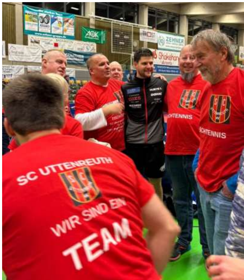
Das Trikot, das alle Uttenreuther tragen, zeigt auf der Rückseite unser Motto: „WIR SIND EIN TEAM“