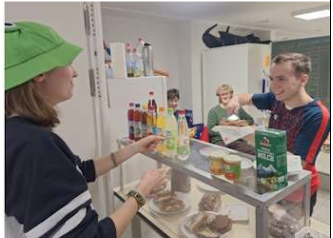
Gute Stimmung in der Kantine